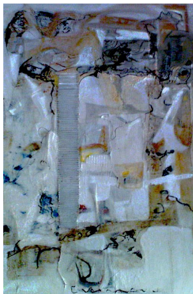
Senza Titolo 2