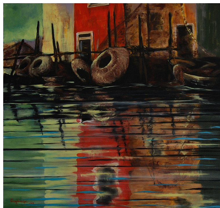
Reti e Ceste Acrilico su Tela - 60x60